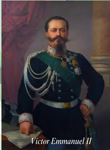
Victor Emmanuel II

La segunda guerra de independencia (1859), la anexión de gran parte del centro de Italia (1860) y, sobre todo, la empresa de los Mil de Giuseppe Garibaldi en el sur (1860) condujeron a la creación del nuevo Estado. El 17 de marzo de 1861, el Parlamento de Turín proclamó a Víctor Manuel II rey de Italia, sellando así el nacimiento oficial del Reino de Italia.