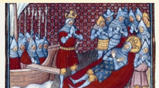
Representación de la muerte de San Luis en África

Después de su muerte, fue considerado el ideal del rey cristiano en Europa. Hoy en día, se le considera un monarca que trajo a Francia un renacimiento espiritual, económico, intelectual y artístico. Se le considera uno de los tres grandes Capetos de la rama directa, junto con su abuelo Felipe Augusto y su nieto Felipe el Hermoso.