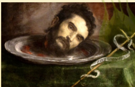
Evangelio de Jesús-Cristo según San Mateo 14,1-11

En aquel tiempo, Herodes, que gobernaba en Galilea, oyó la fama de Jesús