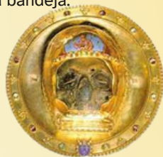
Reliquia principal de la catedral, la cabeza de San Juan Bautista, traída de Constantinopla, está presente en Amiens desde 1206. Esta última se conserva en un relicario de cristal de roca completado en el siglo XIX con una bandeja de plata dorada adornada con piedras semipreciosas y una máscara de esmalte y plata.

Juan Bautista conoció el martirio, encarcelado por denunciar la unión de Herodes Antipas (Rey de Judea) con Herodías, la esposa de su hermano. Juan Bautista fue decapitado a propuesta de Herodías, con la complicidad de su hija, Salomé. Esta última, al final de un baile, pidió a Herodes la cabeza del santo en una bandeja.