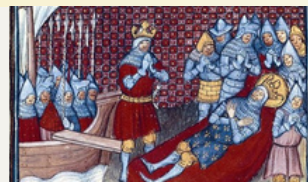
Représentation de la mort de Saint Louis en Afrique

Après sa mort, il fut considéré comme l'idéal du roi chrétien en Europe. Aujourd'hui, il est considéré comme un monarque qui a apporté à la France un renouveau spirituel, économique, intellectuel et artistique. Il est considéré comme l'un des trois grands Capétiens de la branche directe, avec son grand-père Philippe Auguste et son petit-fils Philippe le Bel.