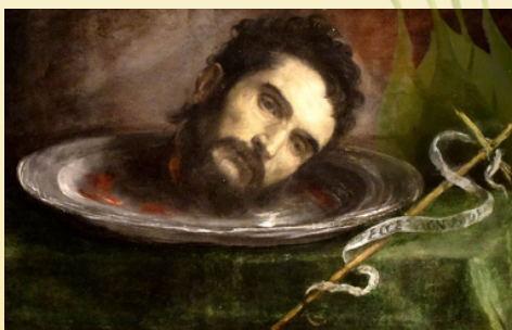
Evangile de Jésus-Christ selon Saint Matthieu 14,1-11

En ce temps-là, Hérode, qui était au pouvoir en Galilée, apprit la renommée de Jésus Et dit à ses serviteurs : « Celui-là, c'est Jean le Baptiste, il est ressuscité d'entre les morts, et voilà pourquoi des miracles se réalisent par lui. »