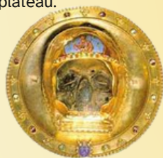
Relique maîtresse de la cathédrale, le chef de saint Jean Baptiste, ramenée de Constantinople, est présent à Amiens dès 1206. Cette dernière est conservée dans un reliquaire de cristal de roche complété au XIX e siècle par un plateau d'argent doré orné de pierres semi-précieuses et par un masque d'émail et d'argent.

Jean Baptiste connut le martyr, emprisonné pour avoir dénoncé l'union d'Hérode Antipas (Roi de Judée) avec Hérodiade, femme de son frère, Jean-Baptiste eut la tête tranchée sur la proposition d'Hérodiade, avec la complicité de sa fille, Salomé. Cette dernière, au terme d'une danse, demanda à Hérode la tête du saint sur un plateau.